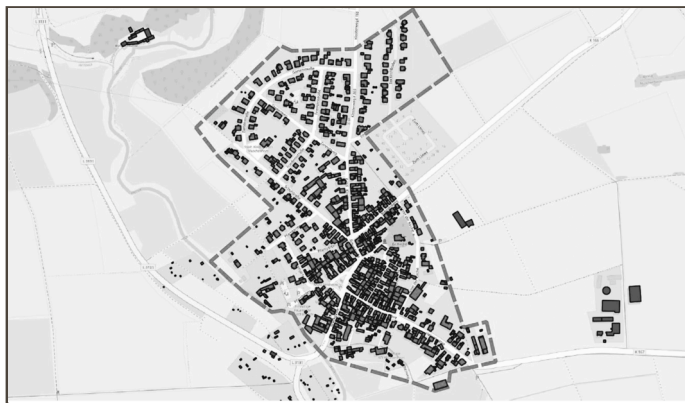
Abbildung 1: Untersuchungsgebiet in Lich-Muschenheim

Auf der Internetseite www.zukunftsquartiere.net werden bereits Informationen über die Arbeiten sowie eine Webinar-Reihe bereitgestellt, deren Teilnahme kostenlos nach Anmeldung möglich ist. Einmal im Monat, immer donnerstags von 19.00 bis 20.00 Uhr, finden die Webinare zu verschiedenen Themen statt. Am 12. Januar 2023 geht es um »Energetische Modernisierung jetzt – Fördermittel zur Gebäudemodernisierung«.